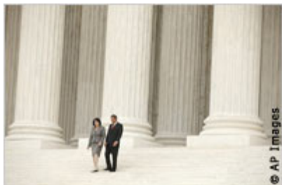
Судью Сою Сотомайор после церемонии ее вступления в должность провожает председатель суда Джон Робертс