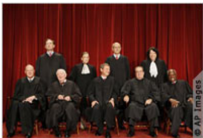
Новый групповой портрет Верховного суда, сделанный 29 сентября 2009 года

В Вашингтоне стоит здание, которое как нельзя лучше олицетворяет власть закона в Соединенных Штатах. Это не Капитолий США, где занимается законотворчеством Конгресс, а здание Верховного суда в одном квартале на восток. Первые полтора века своего существования главный суд страны заседал в Капитолии, в гостях у законодательной власти. Но в 1935 году Верховный суд, наконец, переехал в свой дом, "спроектированный в масштабах, соответствующих значимости и достоинству Суда и судебной системы как равноправной независимой ветви власти в Соединенных Штатах".