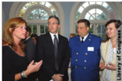
Судья штата Кэтрин О'Молли принимает российскую делегацию в резиденции губернатора Мэриленда в Аннаполисе в 2007 году