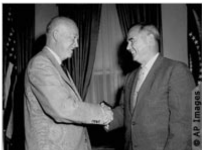
Президент-республиканец Дуайт Эйзенхауэр (слева) выбрал кандидатуру Уильяма Бреннана в Верховный суд