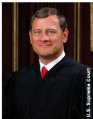
Председатель Верховного суда США Джон Робертс