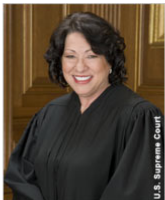
Судья Верховного суда США Соня Сотомайор

президентом Чикагской ассоциации адвокатов в 1970 году. С 1970 по 1975 год занимал должность судьи Апелляционного суда Соединенных Штатов по Седьмому округу. Президент Форд назначил его членом Верховного суда, и он приступил к исполнению своих обязанностей 19 декабря 1975 года.