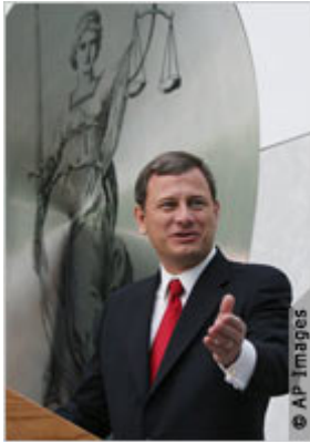
Председатель Верховного суда Джон Робертс

Джон Г. Робертс-мл., председатель Верховного суда США