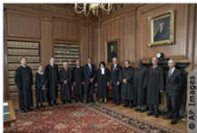
В зале совещаний судей президент Обама и вице-президент Байден позируют вместе с членами Суда