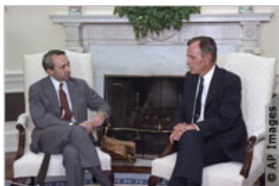
Судья Дэвид Сутер (слева) не всегда следовал политической линии президента Джорджа Буша-старшего.

Тем не менее, у судей есть и свои личные взгляды. Судьи назначаются путем политической процедуры. Наблюдатели, естественно, должны задаться вопросом, насколько большую роль в действительности играют их политические взгляды. Некоторые исследователи утверждают, что политические предпочтения судей играют большую роль, особенно в том смысле, что именно этими предпочтениями диктуются решения, принимаемые ими по многим делам. Они указывают на то, что судьи, назначенные президентами-консерваторами, как правило, голосуют в консервативном русле, а те, кого назначают либеральные президенты, голосуют противоположно. Битвы за утверждение недавно назначенных судей явно предполагают, что многие считают личные политические пристрастия судей важным фактором принятия судебных решений.