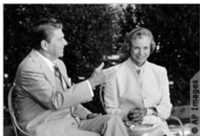
Судью Сандру Дей О'Коннор назначил в состав Верховного суда президент Рональд Рейган

Буквально за десять лет работы в Суде Роберт Джексон превратился из твердого защитника президента в одного из самых влиятельных сторонников ограничения президентских полномочий.