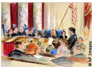
Рисунок, сделанный во время процесса в Верховном суде