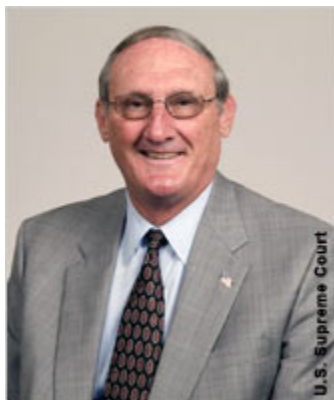
Клерк Верховного суда Уильям Сутер

Статья представляет собой выдержку из журнала "Верховный суд США: равное правосудие по закону"